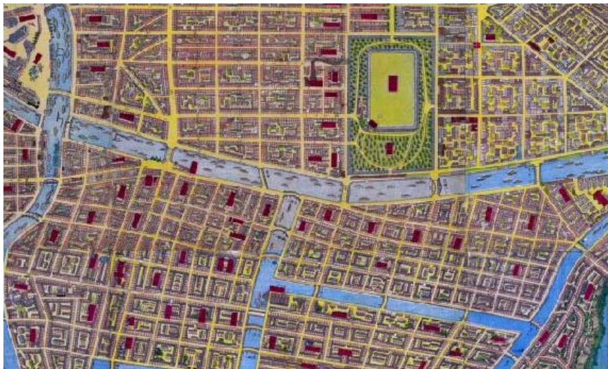
「横浜真景一覧図絵」(部分)

まずは、開港以来の横浜の歴史を知るために、横浜中央図書館や横浜開港資料館等の協力を得ながら連続講座を開催していきます。講師はいろいろな博物館や資料館の研究員・学芸員を依頼していく予定です。また、講座をきっかけに集まった方々とともにさらに次のイベントを企画していきたいと考えています。