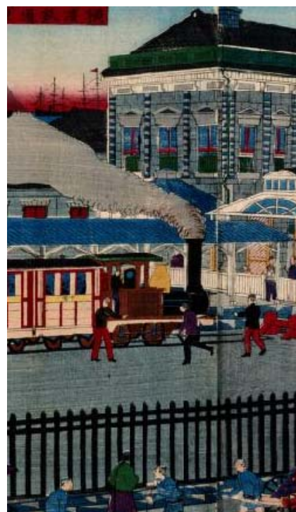
「横浜鉄道館蒸気車往返之図」(部分)

多摩川から横浜に引いた木樋水道(明治6年完成)と同時期におこなわれた人糞処理の実態を紹介します。