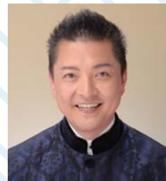
朝岡 聡 フリーアナウンサー