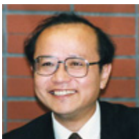
宮脇 淳 （北海道大学公共政策大学院教授）