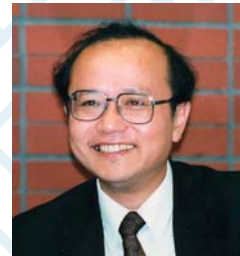
宮脇 淳 北海道大学公共政策大学院教授