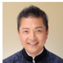
朝岡 聡 （フリーアナウンサー）