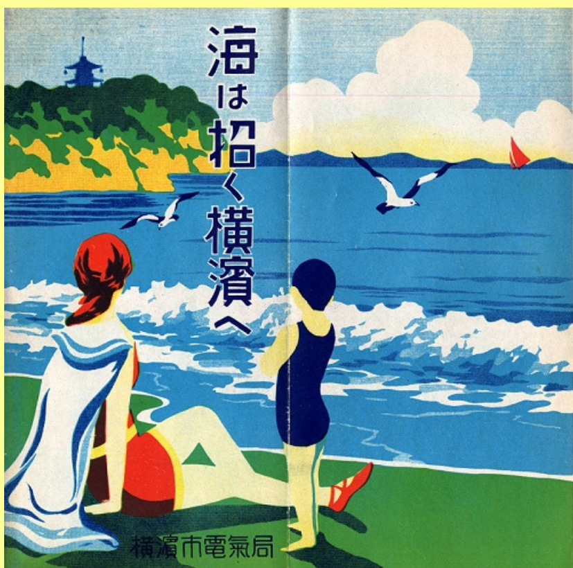
『横浜市電気局作成 パンフレット』昭和初期