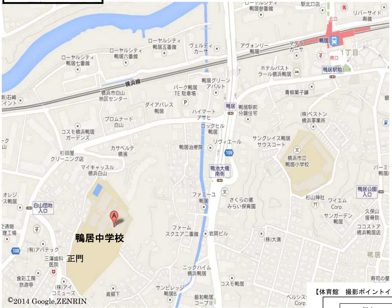
【体育館 撮影ポイントイメージ図】