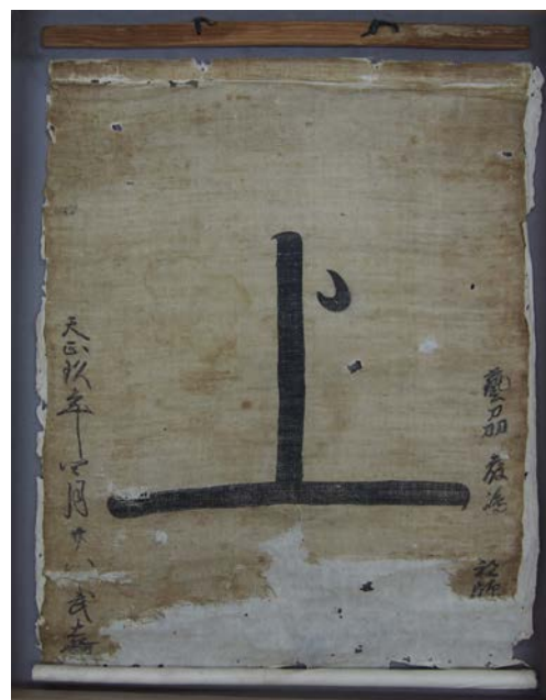
上：過所船旗 左：能島村上家文書