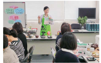
<セミナーイメージ>

家事に抵抗感を感じている男性でも、まずお茶をいれることから手軽に家事参画を考えるきっかけになり、また、お茶を飲みながら夫婦で話し合う時間をつくることで、家庭内のコミュニケーション形成にもつながります。