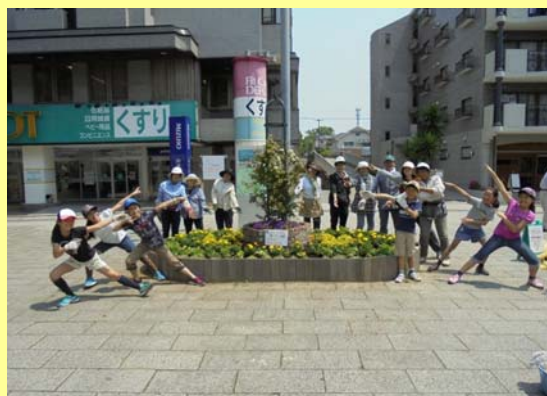
駅前広場に整備された花壇の様子

また、空き家を活用した交流拠点の整備も行い、遊びや体験を通して子どもと大人が交流する場づくりに地域一体で取り組み、地域課題の解決を実践しています。