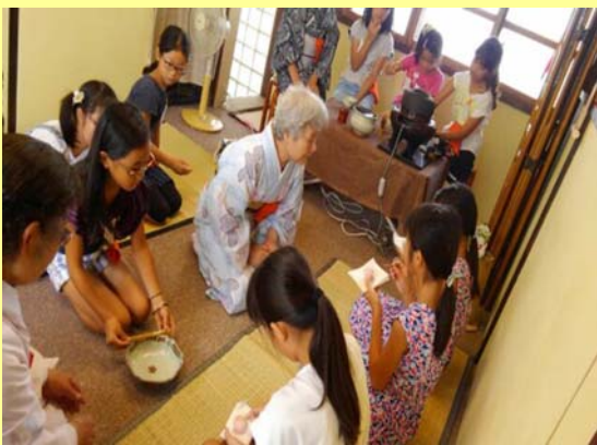
「人材マップ」を生かした活動の様子