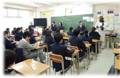
子どもたちとの交流