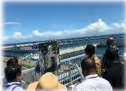
南本牧第5ブロック廃棄物 最終処分場の視察

【日時】2月21日(木) 13:15~15:45 【場所】・神明台処分地 ・南本牧第5ブロック廃棄物 最終処分場