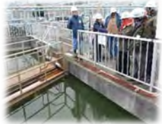
神明台処分地の視察