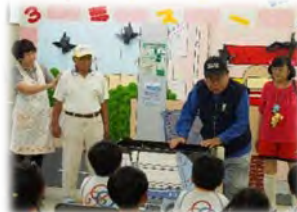
環境事業推進委員 の取組紹介