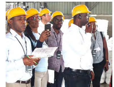
市内企業等への視察