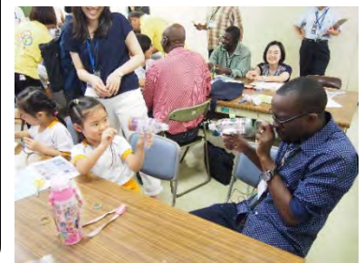
子どもたちとの交流